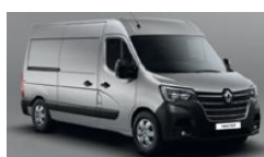
KNH GRÅ ETOILE