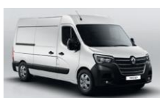
QNG MINERAL HVID