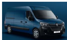
RNQ BLÅ VOLGA