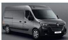
KPW URBAN GRÅ