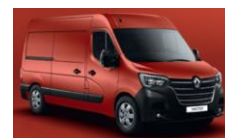
719 RØD MAGMA